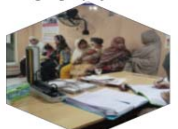
العيادات الخارجية راولبندي

4- مركز العيادات الخارجية بركت امير الدين لاهور 28- بازار ، شارع عابد مجيد لاهور ، كينت ، رقم التواصل: 04236672471