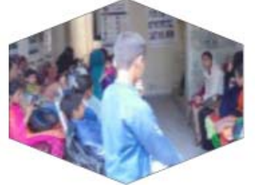
العيادات الخارجية لمركز لاهور

2- مركز الرعاية الصحية السيدة الدكتور محمد اختر (المرحومين)، كراتشي 130-ب بالقرب من مسجد العثمانية ، عباس تاون ، شارع ابو الحسن اصفهاني ، كراتشي رقم التواصل: 02134651723