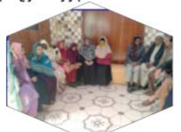
العيادات الخارجية لاهور