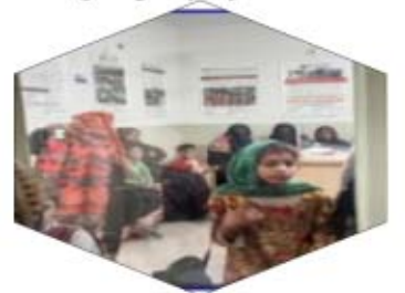
العيادات الخارجية كراتشي

3- مركز العيادات الخارجية غلاب خان و كنيز فاطمة (المرحومين) راولبندي 339- شيمه بلازه ، رحمت اباد ، مكه شوك ، برانا دراي بورت ، لاهور شكلايه سكيم 3، راولبندي رقم التواصل: 0515501723